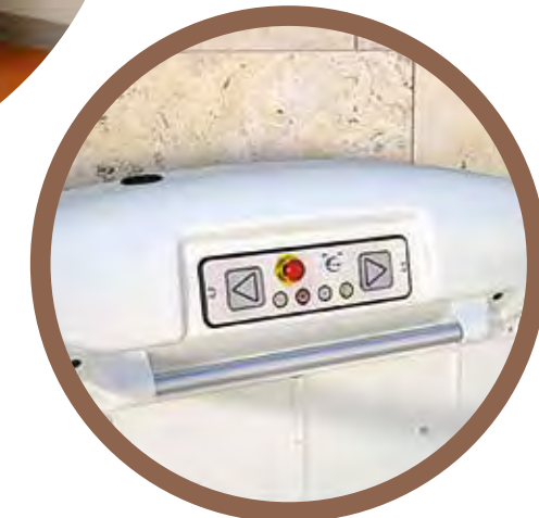
PANEL DE CONTROL INTEGRADO