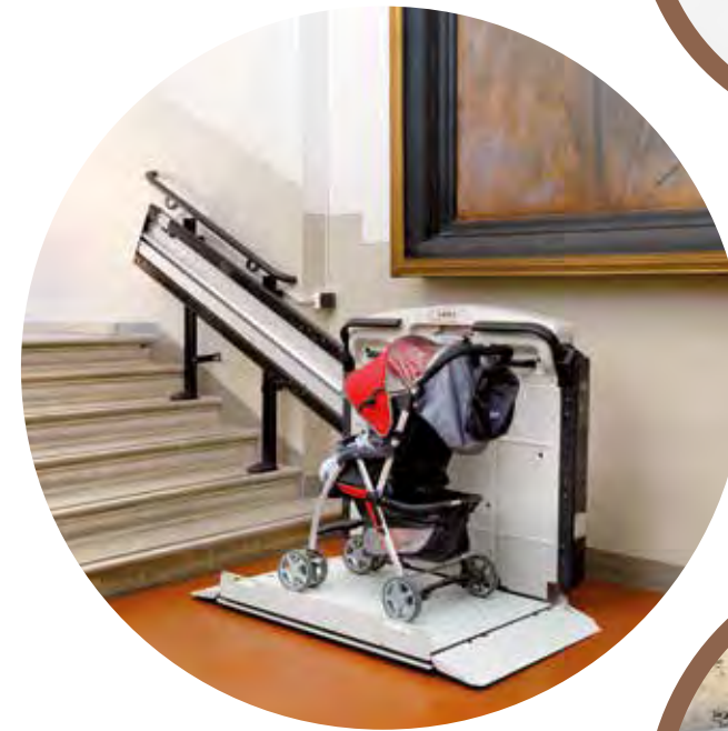
V65 CON BARRAS RETRACTILES