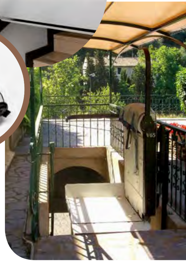
V65 CON BARRAS INDIPENDIENTES